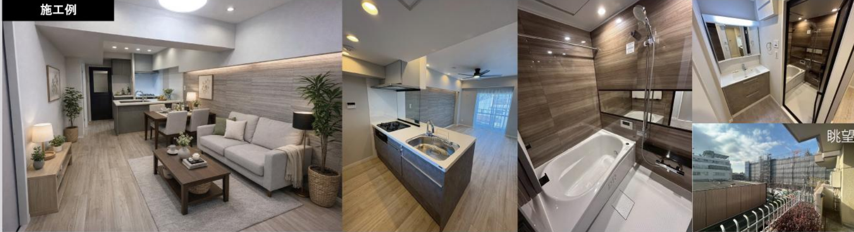
※施工例となりますので、完工後異なる場合がございますのでご了承ください。