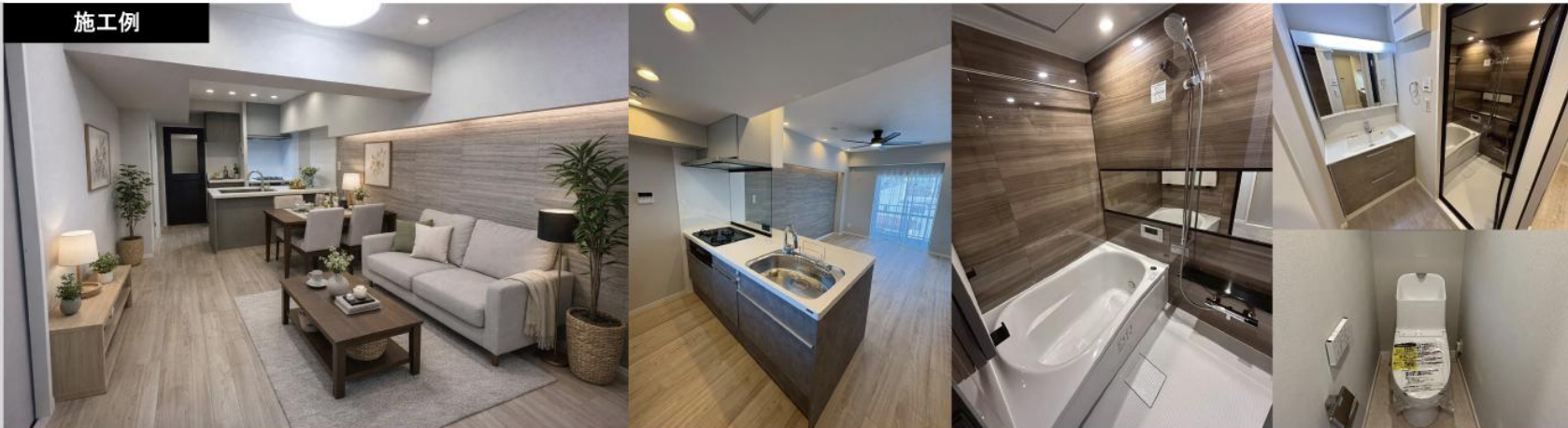
※施工例となりますので、完工後異なる場合がございますのでご了承ください。