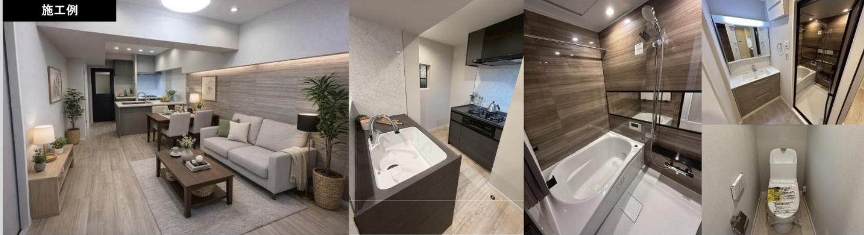
※施工例となりますので、完工後異なる場合がございますのでご了承ください。